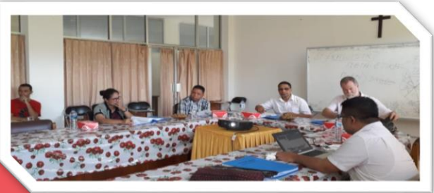
Seminar Hasil Penelitian Tesis Mhs ProgdI Teologi PPs UKAW