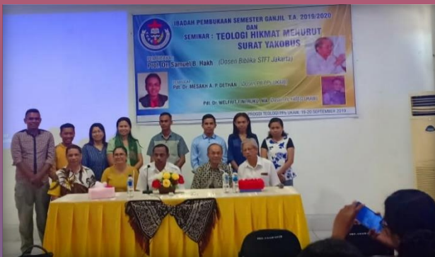
Ibadah Pembukaan Semester dan Seminar