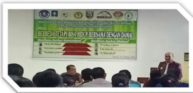
Kegiatan Sekolah Perdamaian II