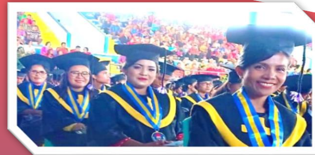
Wisudawan PPs UKAW Periode April 2019